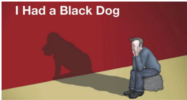
Slika 3: Imel sem črnega psa (I Had a Black Dog, 2005) je odlična slikanica in animirani film Matthewa Johnstona, ki je na voljo na spletni strani SZO za preventivno, izobraževalno in terapevtsko delo z depresirajočimi ljudmi.